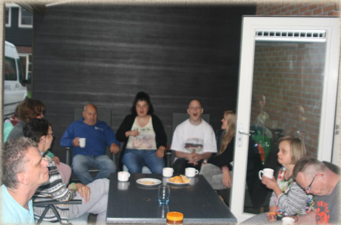
En de andere vakantievierders.....