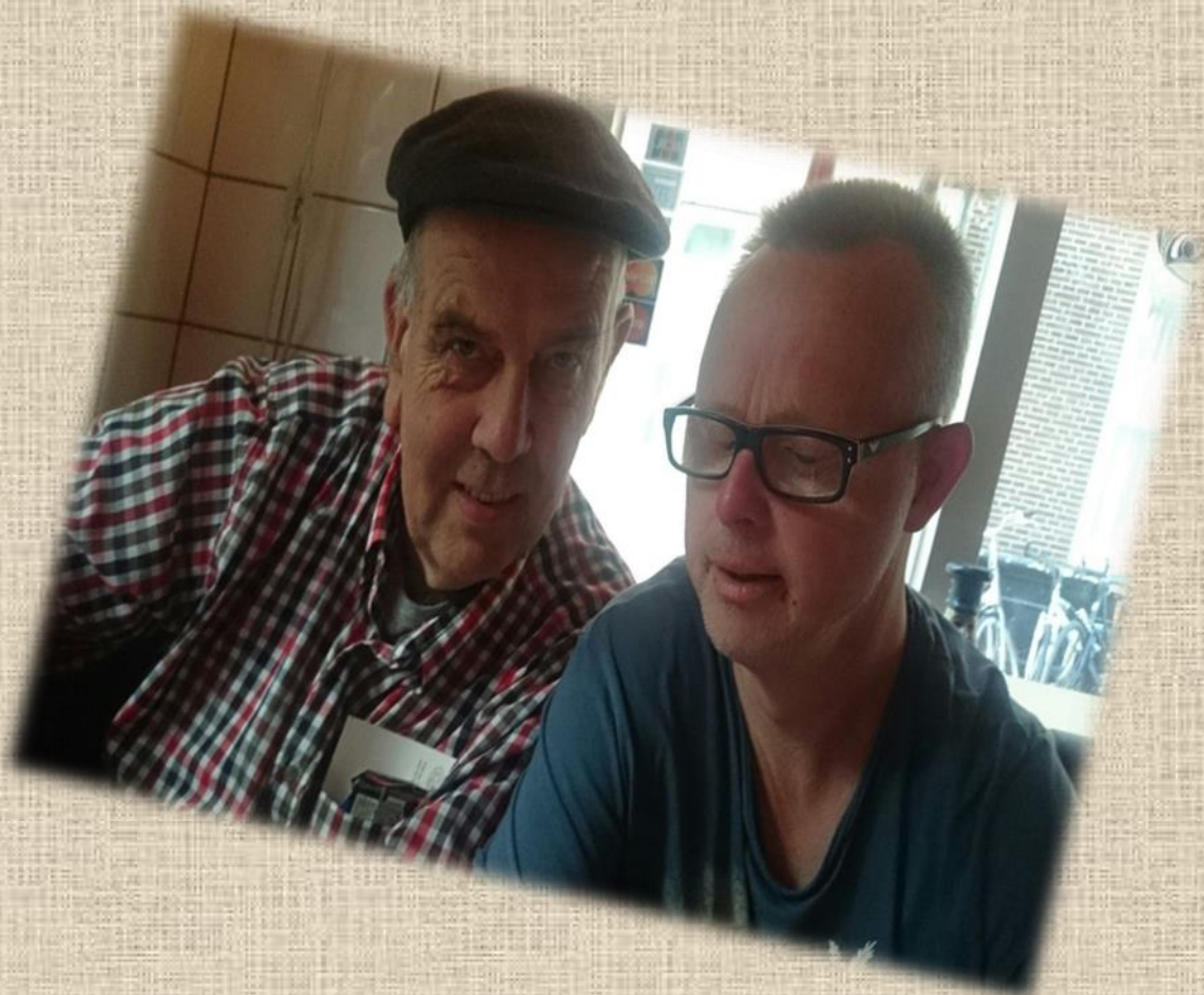
Met zijn allen aan tafel