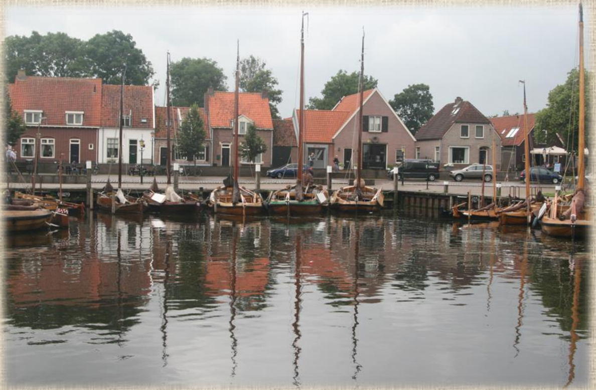
De oude haven met zijn botters

en we pakken ons laatste terrasje van deze vakantie. Als afsluiter gaan we in Harderwijk uit eten met ijs als toetje natuurlijk.